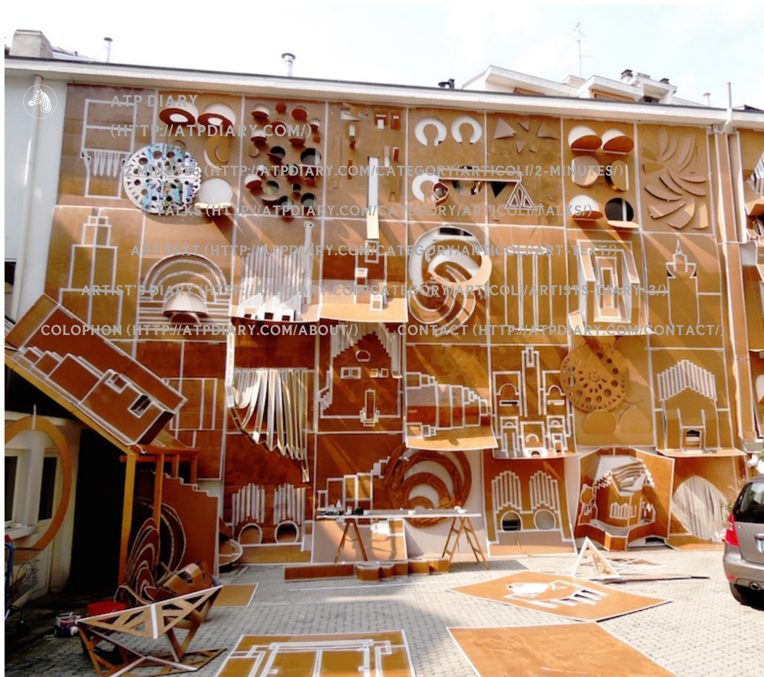
( http://atpdiary.com/wp-content/uploads/2015/09/Daniel-González-Pop-Up-Building-Milan-makingof-2.jpg )

CS – POP-UP Building Milan – Marsèlleria 2015 ( http://atpdiary.com/wp-content/uploads/2015/09/CS_POP-UP-BUILDIN )