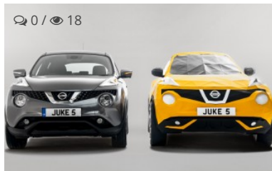
Nissan - La macchina origami